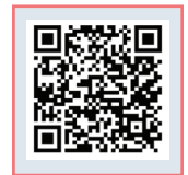
सीआईईटी वेबसाइट से कोर्स तक पहुँचे